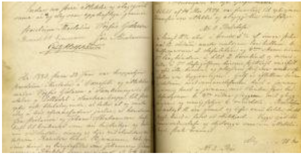
Úttekt í Litla-Dal í Saurbæjarhreppi.