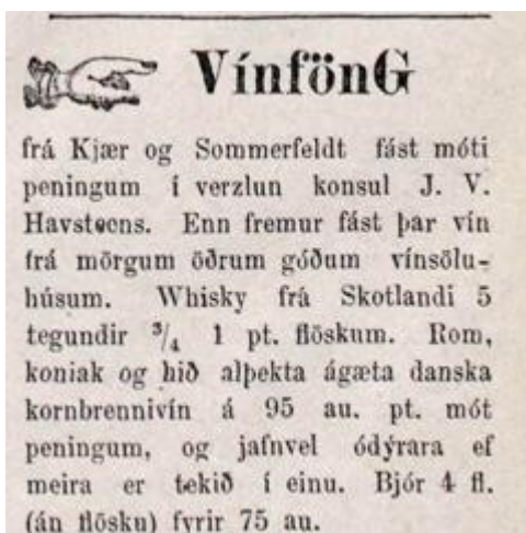
Auglýsing í Gjallarhorni 1905 frá Verzlun J.V. Havsteens.