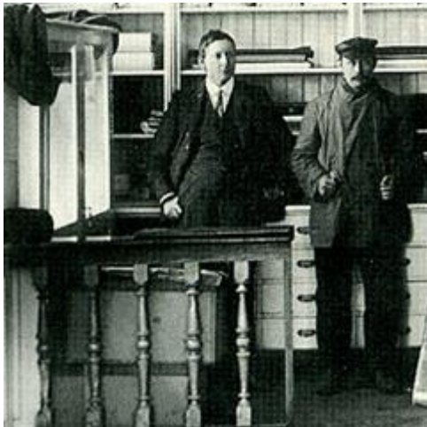
Úr „Hvítu búðinni“ þ.e. Höpepfnersverzlun. Í stóru herbergi inn af búðinni voru fjórar stórar tunnur á stökkum, brennivín, koniak, romm og messuvín.